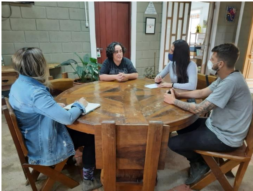
Reunião de equipe com a terapeuta de família.