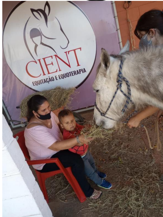
Participação da família na atividade de manejo