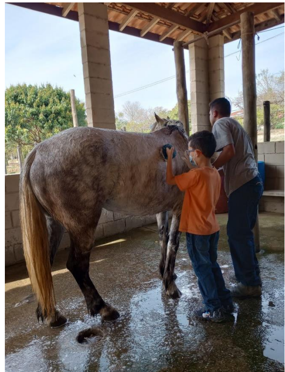
Atividades e Terapias Assistidas com Cavalos